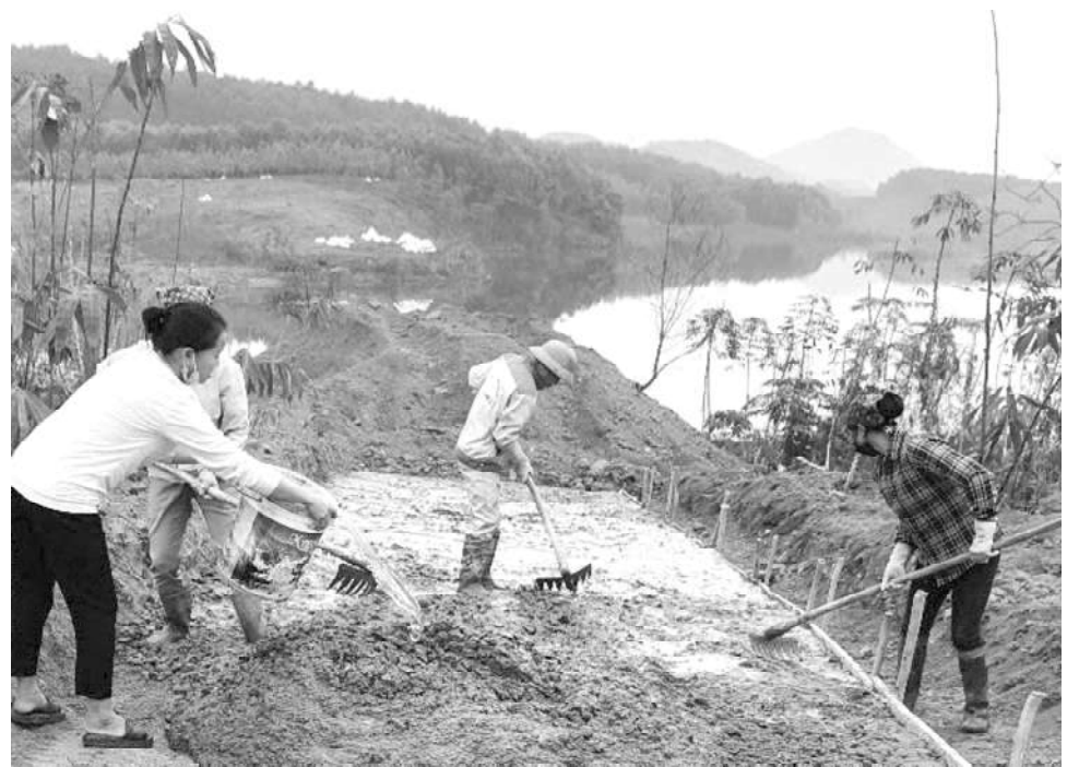
Người dân thôn Ngòi Ngừ, xã Bảo Ái tham gia kiên cố hóa đường giao thông nông thôn tại tuyến đường xóm Ngòi Tha đi hồ Thác Bà.

ngày đầu cuối tháng 12 âm lịch tuy có rét đậm nhưng Trưởng thôn Ngòi Ngừ - Lục Văn Đỉnh đã ra công trường từ sớm để đón đốc đơn vị thi công nốt 600 m đường từ xóm Ngòi Tha (thôn Ngòi Ngừ) ra hồ Thác Bà, huy động nhân dân sửa, đắp lề đường. Anh Đỉnh phấn khởi: "Ngay từ những tháng đầu năm 2024, UBND xã thông báo kế hoạch phân bổ nguồn vốn hỗ trợ làm đường GTNT cho thôn Ngòi Ngừ bê tông hóa 1,5km đường từ hội trường thôn đi sang xóm Ngòi Tha 900m và đường từ xóm Ngòi Tha ra hồ Thác Bà 600m. Thôn đã tổ chức họp dân ở hai tuyến đường này để thống nhất mức đóng góp tùy theo hoàn cảnh của từng hộ; hộ khá giả đóng trên 15 triệu đồng, hộ khó khăn hơn đóng khoảng 10 triệu đồng để cùng với nguồn vốn đầu tư của Nhà nước bê tông hóa hai tuyến đường này. Sau khi tổ chức họp cho các hộ bàn bạc, thống nhất mức đóng góp xong, cán bộ thôn tiếp tục đi vận động các hộ dân nằm trên hai tuyến đường dịch rào, hiến đất giải phóng mặt bằng để khi có nguồn vốn đầu tư về triển khai làm đường kịp thời. Đến đầu tháng 12/2024, khi có nguồn vốn phân bổ về bằng xi măng, cát, sỏi đến chân công trình, thôn đã cùng với các hộ dân thuê đơn vị thi công triển khai bê tông hóa xong tuyến đường 900m từ hội trường thôn sang xóm Ngòi Tha trước và tiếp tục thi công nốt 600m đường từ xóm Ngòi Tha đi ra