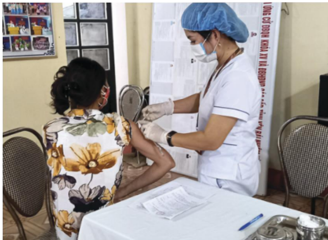
Ngành y tế đang đẩy nhanh tiến độ tiêm đủ vắc-xin phòng Covid-19 cho các đối tượng.