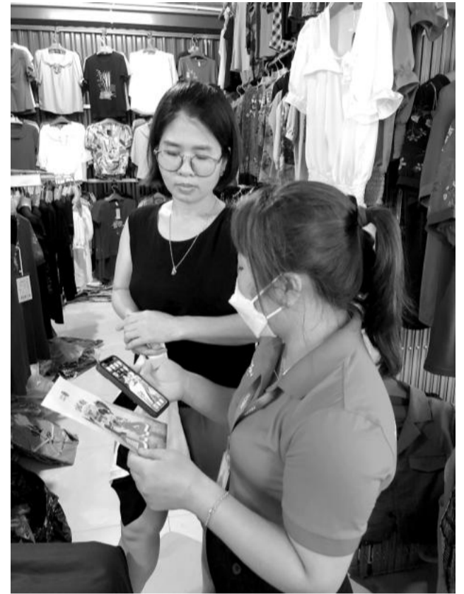
Việc thanh toán không dùng tiền mặt trong các giao dịch mua bán đã dần trở thành thói quen của các doanh nghiệp và người dân trên địa bàn tỉnh. Trong ảnh: Người dân thực hiện chuyển khoản thanh toán trong mua bán hàng hóa tại chợ Bến Đò, thành phố Yên Bái.

chiếm 55,75% tổng giá trị kinh tế số trên địa bàn, với giá trị đóng góp ước đạt trên 1.555 tỷ đồng (tăng 8,7%); 6 tháng đầu năm 2024 kinh tế số ICT tiếp tục tăng trưởng cao, dự kiến >10%.